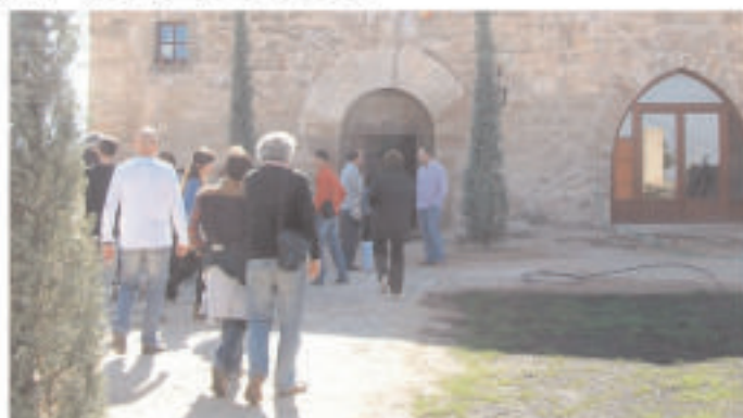
• 13 d'octubre, sortida atípica amb un esmorzar de forquilla a Torrebesses i posterior visita al museu de la pedra seca i el castell.