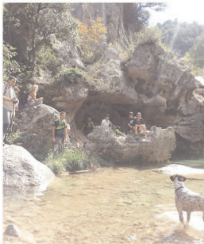
• 30 de setembre, sortida als gorgs de la Febró, amb bany inclòs.