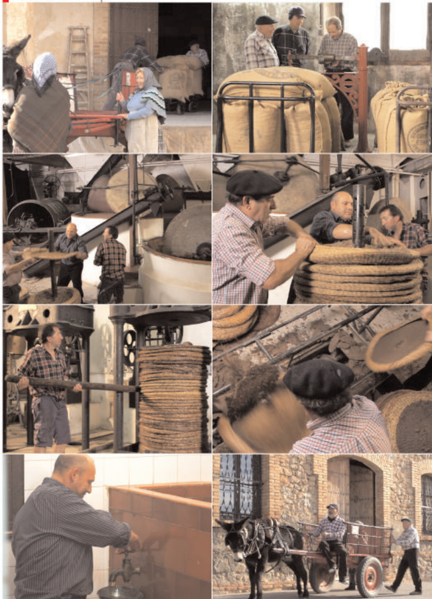
• Dia 5 de novembre es posà en marxa l'antic molí com a fons documental pel Museu de l'Oli de Catalunya que fa l'Ajuntament a la Cooperativa.