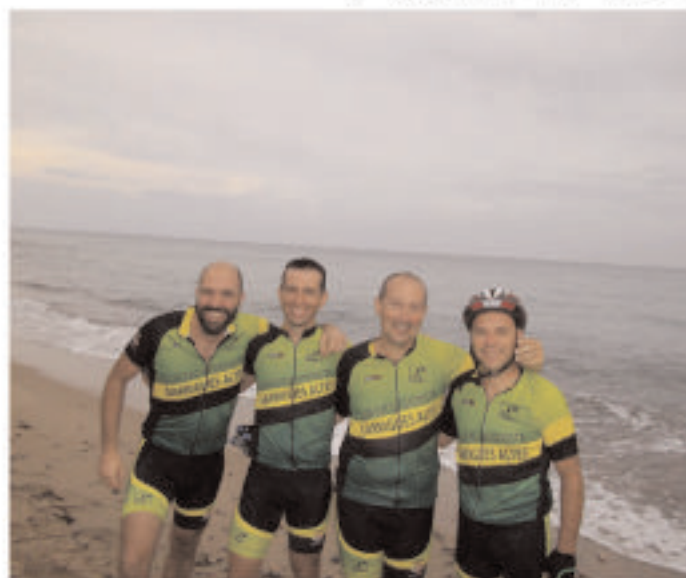
• 9 de setembre, pedalada des de La Granadella fins a Miami (Platja).