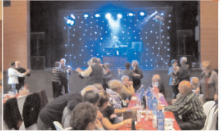
• Castanyada 2013, la Llar de Jubilats la vàren celebrar com en aquests darrers anys. També es va fer un sopar pel poble amb 150 assistents.