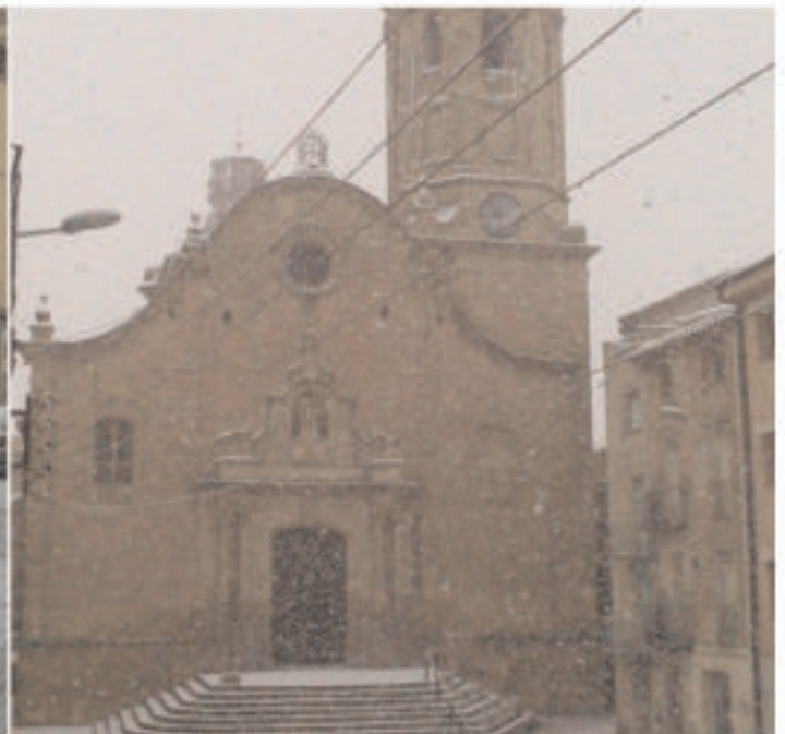
• Feia quatre dies que aviem començat l'oliva amb mànega curta i, fora de tota previssió, dia 16 de novembre van caure 8 centímetres de neu.