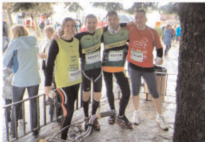
• 17 de novembre, Volta a l'estany d'Ibars 2013