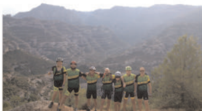
• Sortida, una de les tantes, amb BTT, en aquest cas pel Montsant.