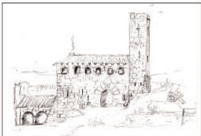
• Castell de la Granadella vs. 1700 ex-profeso 1er. esboç 24-7-2012.