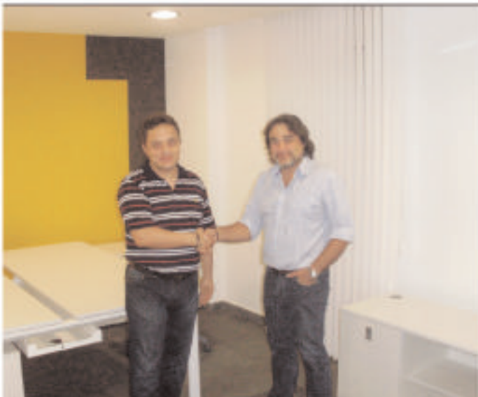
• A principis d'octubre s'instal·la al Viver d'Empreses l'assessoria de serveis generals AIMon, quedant així tots els despatxos plens.