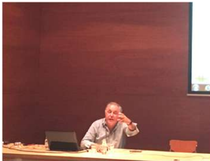
• 9 de juny, xerrada sobre "Història de Catalunya" impartida per l'Iu de Pesillà de la Ribera com a acte del 30é aniversari de la Llar de Jubilats, l'endemà hi va haver un dinar de germanor al Centre Cívic.