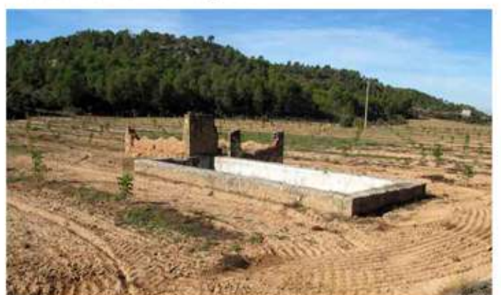
• Pou de la Figuera Pinyol