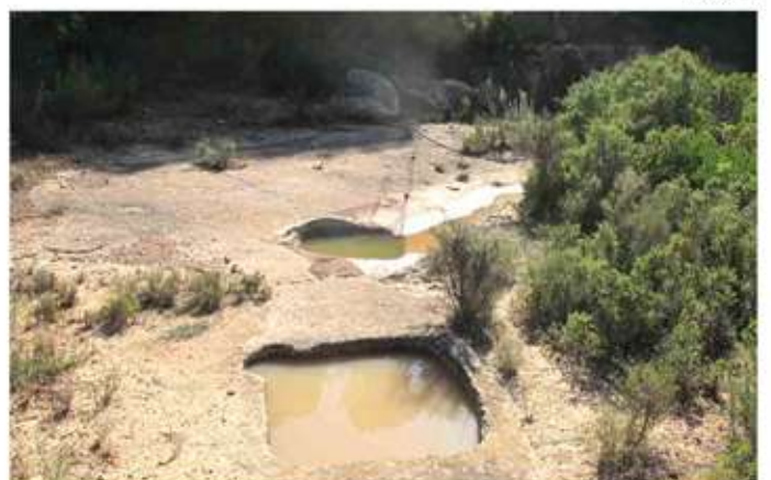
• Cadolles del Fanxequet