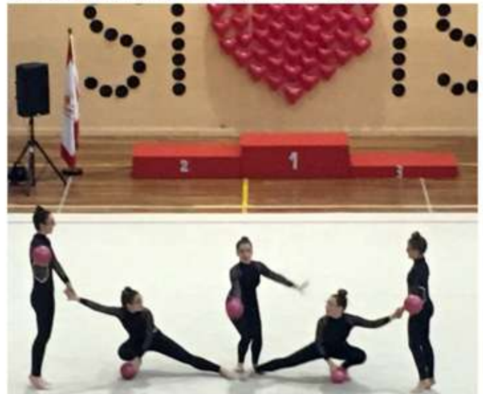
• 24 de març, exhibició de les gimnastes de rítmica al club Sícoris de Lleida.