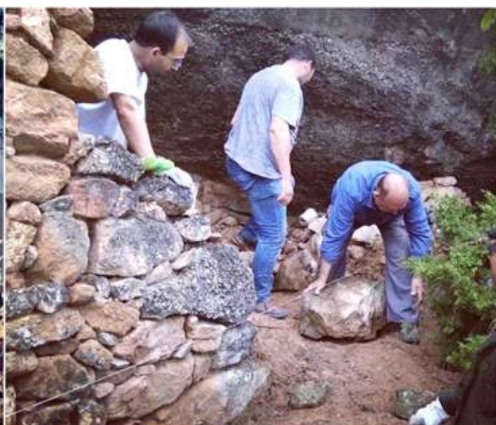
• Del 2 al 3 i del 16 al 17 de juny, la Universitat d'estiu de Lleida, realitza el curs teòric i pràctic sobre la pedra seca, obert a tots els públics i per tercer any a La Granadella (entre altres intervencions, es reconstruirà la balma murada de ca l'Aran, a les Figueres). Aquest any també s'ha obert a Torrebesses i al Centre d'Interpretació de las Pedra Seca.