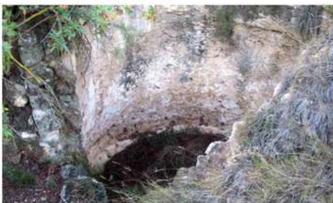
• Forn de calç de les Comunglores