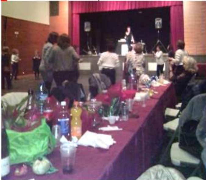
• 10 de març, sopar de l'associació de dones "El Roure".