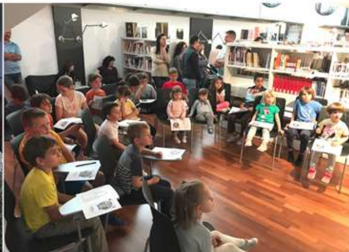
• Activitats dels Clubs de lectura de la mediateca Emimi Pujol. Divendres dia 25 de maig, a la nit, els més petits van "aconseguir alliberar ala Nenúfar i la Matoll del ClubSuper3", són uns cracs!