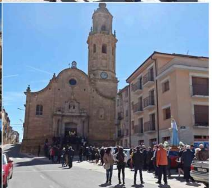
• Divendres Sant i porcessó de l'encontre.