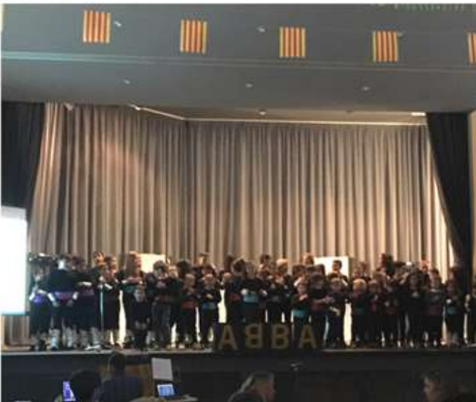
• 23 de març, musical ABBA a la Festa de la ZER a Bovera.