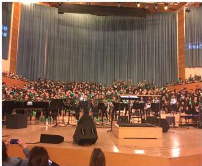
• 8 de juny, cantata "Partícules" a l'Auditori de Barcelona, uns 800 nens i nenes de tot Catalunya, entre d'altres el dels cycle mitjà i superior de la ZER Elaia.