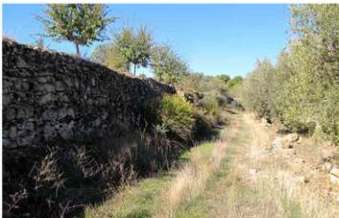
• Carredrada de Sant Pere