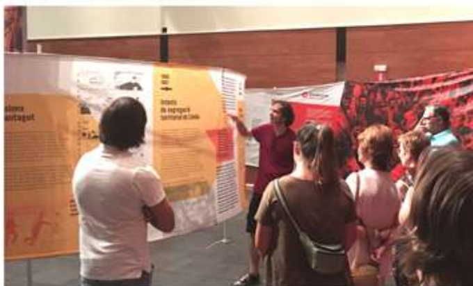
• Del 18 al 27 d'agost, exposició al Centre Cívic d'Òmnium "Lluites pels drets de la ciutadania i el territori", entre altres les famoses "tractorades" de finals dels anys 70.