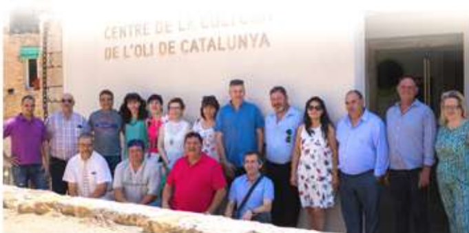
• 10 de juny, rebuda al CCOC dels qui celebraren els seus 50 anys.