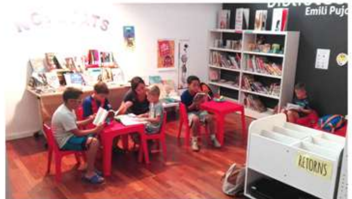
• Esplai d'estiu, mesos de juliol i agost. Visita al Club de lectura.