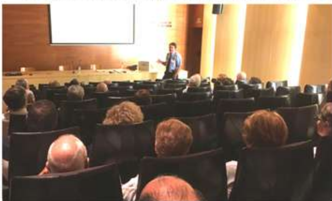
• 11 d'agost, xerrada dels mossos d'escuadra sobre seguretat en les llars a raó de diversos robatoris soferts recentment a la població.