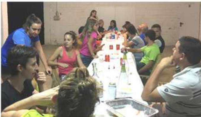
• 14 de juliol, sopar a l'ermita i caminada nocturna del Club Excursionista Garrigues Altes.