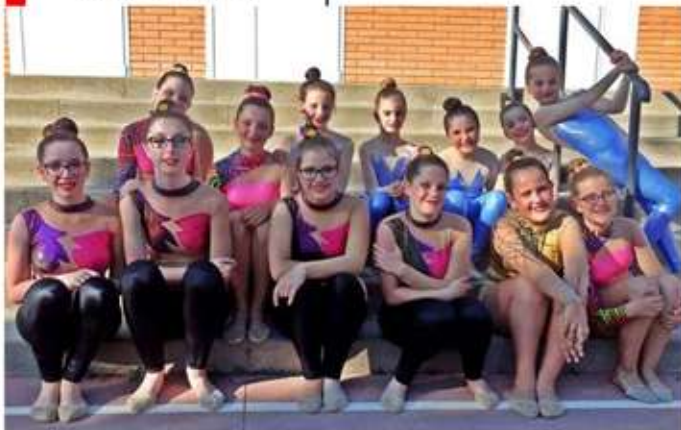
• 11 de juny, exhibició de les nostres gimnastes de rítmica.