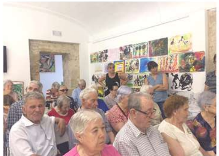
• Participació del Centre de Serveis als processos creatius d'Oleaterra.