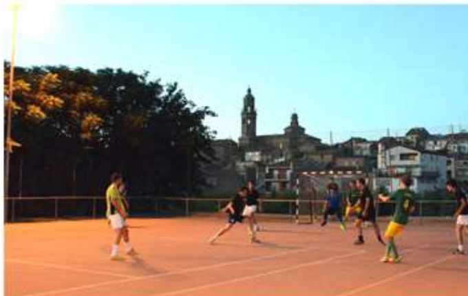
• Un estiu més hem pogut gaudir amb l'èxit de "la Granadella League", que acabà el 26 d'agost amb un sopar a les piscines, amb sorteijos, entrega de copes i dicoteca.