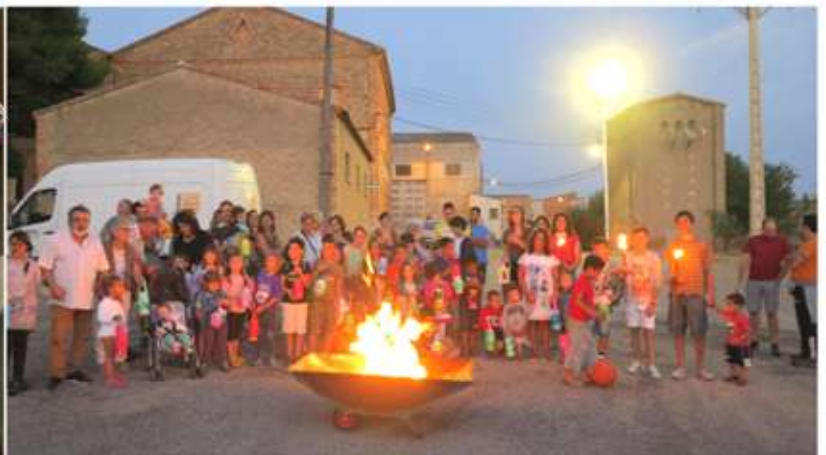
• Taller de fanalets per la foguera de Sant Jaume.