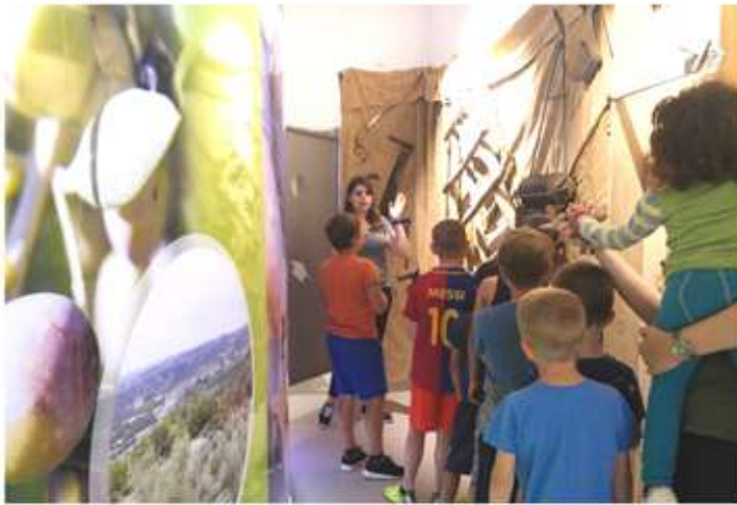
• Visita i tallers de l'esplai al MuOC.