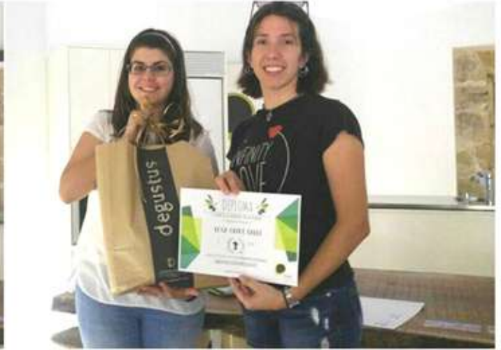
• 21 de juliol, entrega de premis i diplomes del concurs d'Instagram "Primavera 2017".