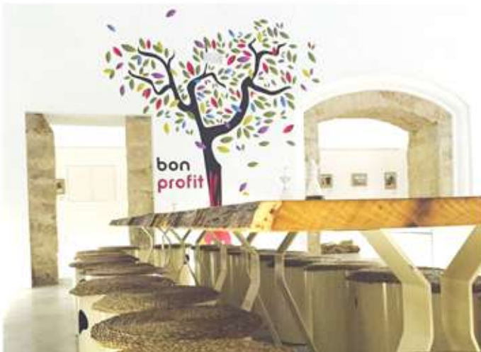
• Visites guiades concertades i de cap de setmana.