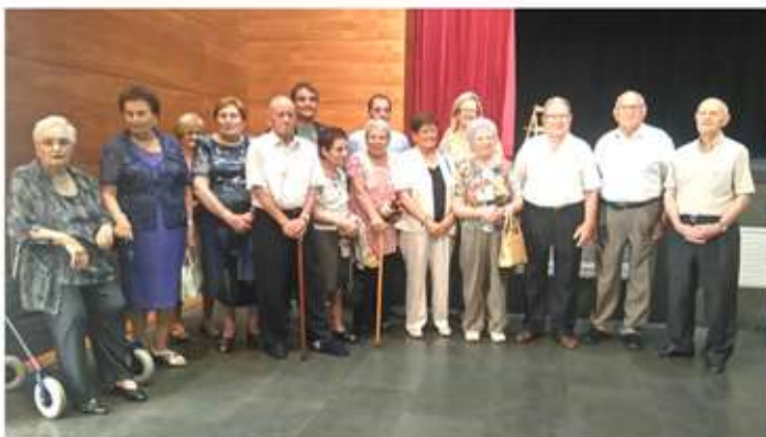
• 30 de juliol. Homenatge de l'Ajuntament en reconeixement a la Gent Gran.