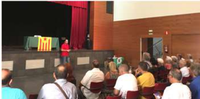
• 30 de juliol, xerrada del diputat al Parlament, Ferran Cívit, al Centre Cívic sobre "Garanties per la democràcia".