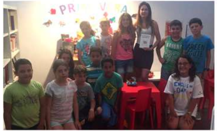
• Juny, entrega a la mediateca del llibre "La puerta secreta", escrit conjuntament pel alumnes de cycle mitja i superior de l'escola.