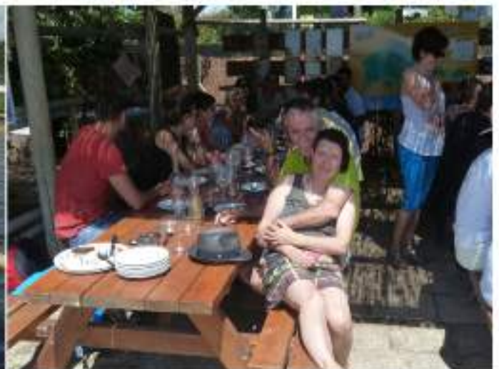
• Con ja va sent costum, els dies 2 i 3 d'agost, una delegació de la Granadella, va anar a la Festa Major de Pesillà de la Rivera, allí ens vàren tractar excel·lentment, i el diumenge es va fer una sortida a la platja.