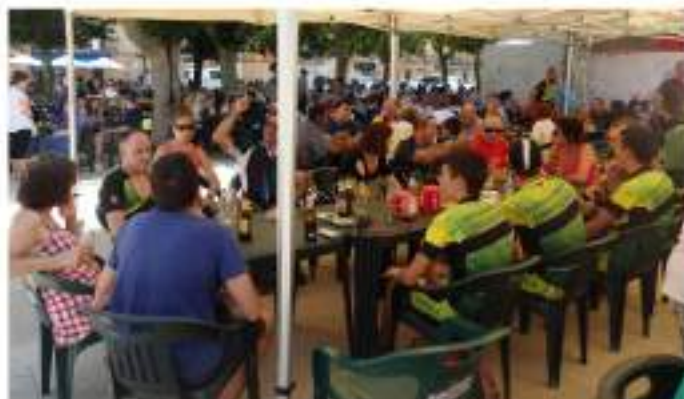
• Gairebé totes les sortides de matí a pedalar s'acaben al mateix lloc.