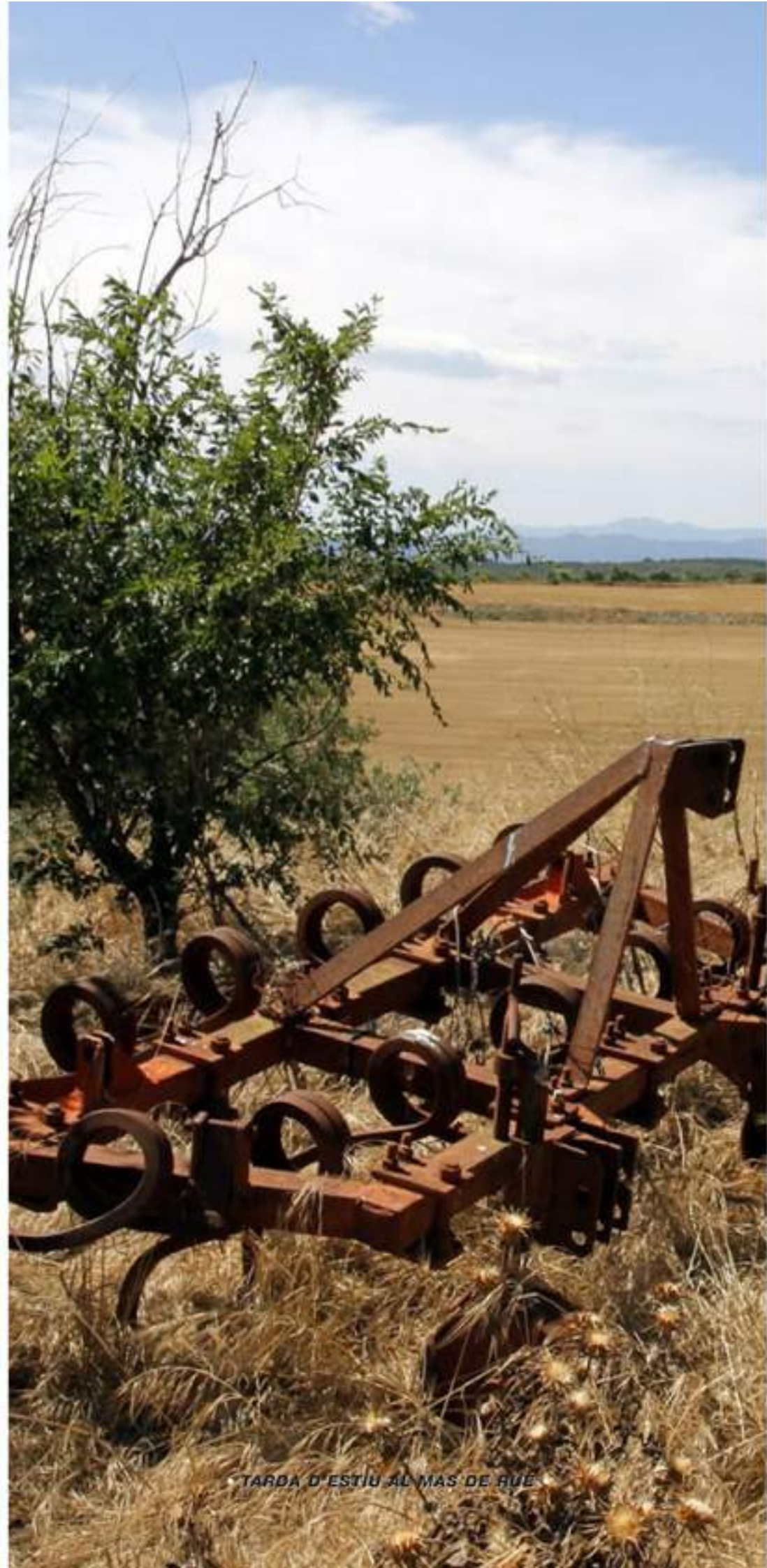
TARDA D'ESTIU AL MAS DE RUE