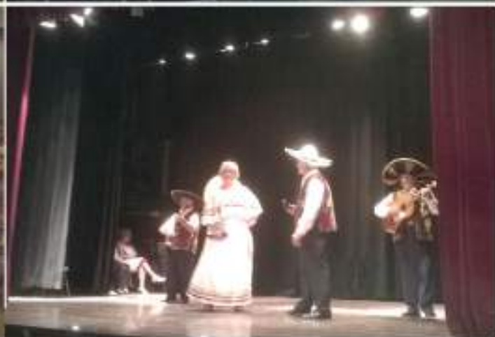
• 18 de juny, trobada amb les famílies al Centre de la Gent Gran, dinar i escaia en Hi-Fi al Centre Cívic.