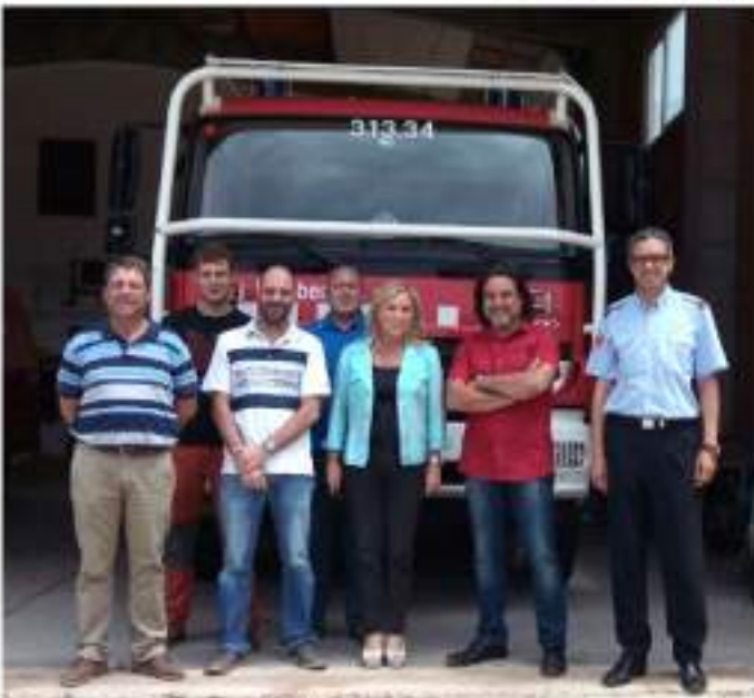
• 12 de juny. Visita al parc de la delegada d'interior i del cap de zona de bombers.