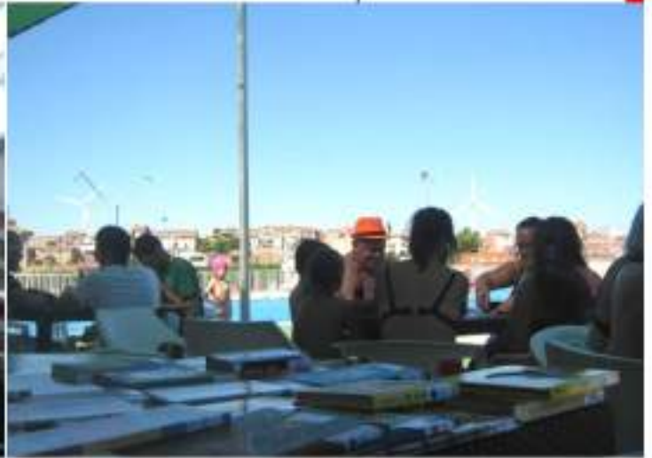
• Activitats d'estiu de la biblioteca: bibliocursa i bibliopiscina.