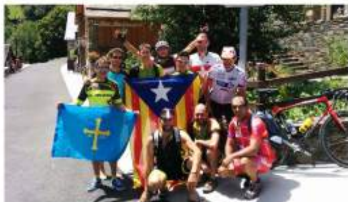
• Finals de juliol. Expedició al Tour de France de ciclistes del Club, prop del Tourmalet.