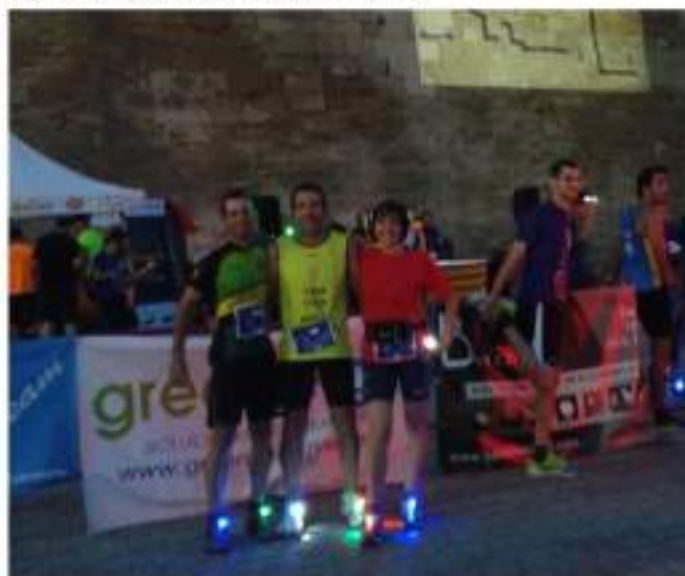
• 25 de juliol, "Lleida Night Run", il·luminant amb els peus el turó de la seu.