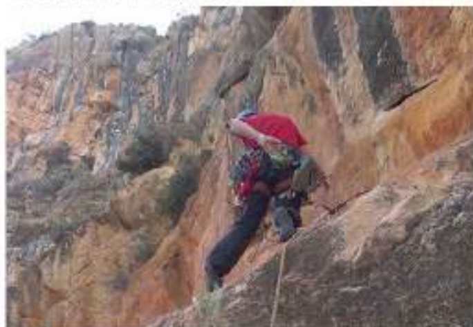
• Escalant a la via Quimera 6a+.

La Junta Directiva clubexcursionistagarrigues@gmail.com facebook: Club Excursionista Garrigues Altas