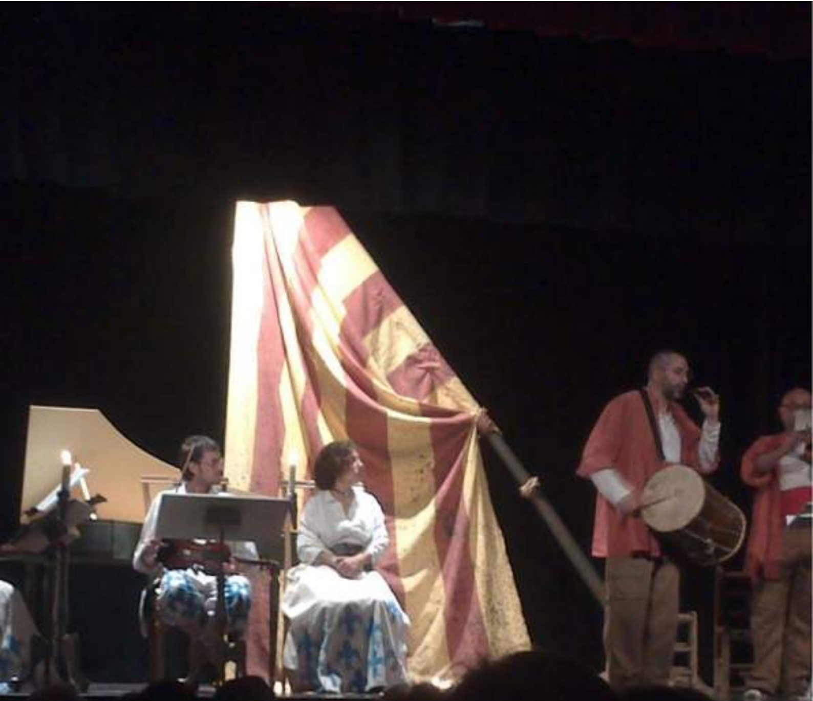
REPRESENTACIÓ DEL "SETGE DE LLEIDA 1707", AL CENTRE CÍVIC, DINS DELS ACTES DEL FESTIVAL DE MÚSICA