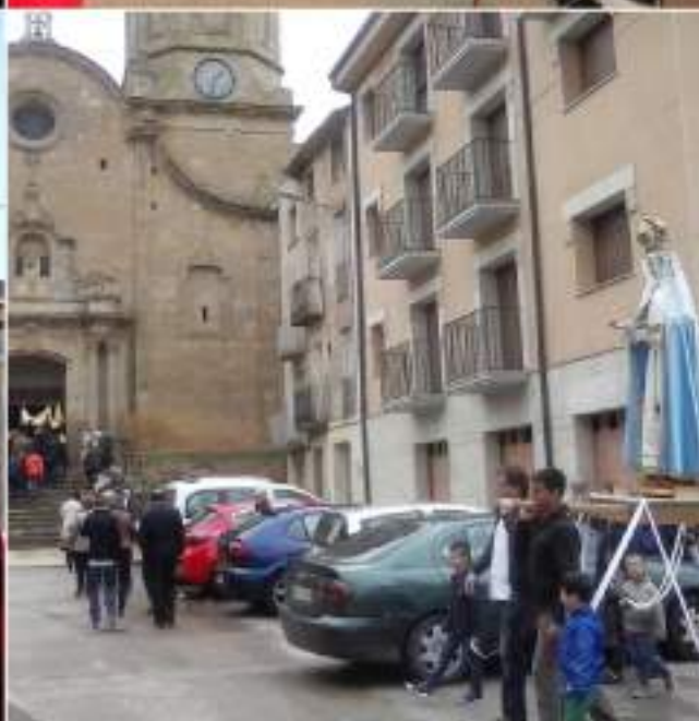
• Procesons, calvari i desclavament de Setmana Santa.