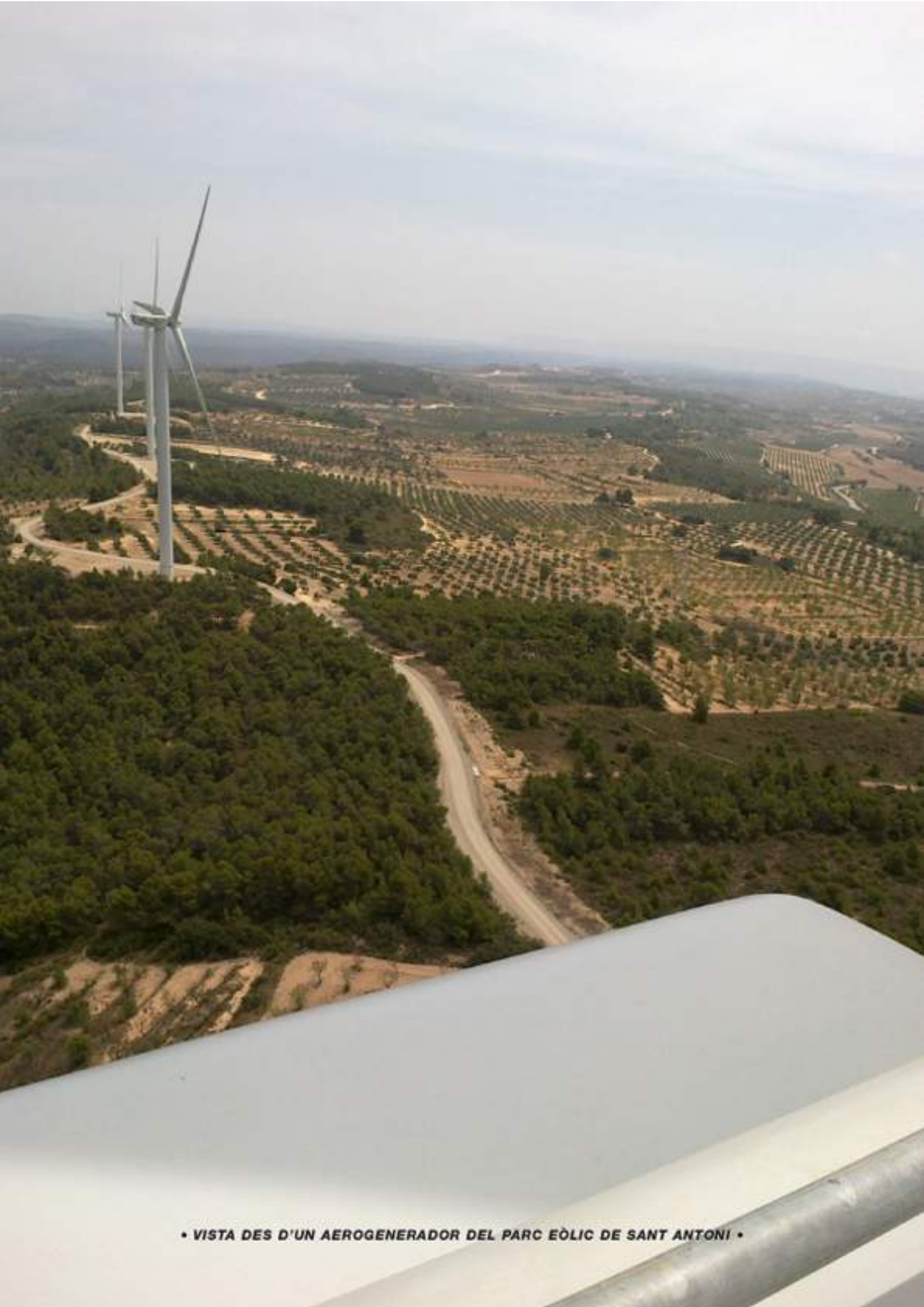
• VISTA DES D'UN AEROGENERADOR DEL PARC EÒLIC DE SANT ANTONI •